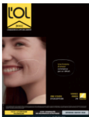
Le dernier numéro de L'OL MAG

🕒 18 Mai 2022 👤 Posted By Emmanuel Grolleau 📁